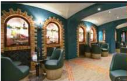
LA CANTINA DI BACCO