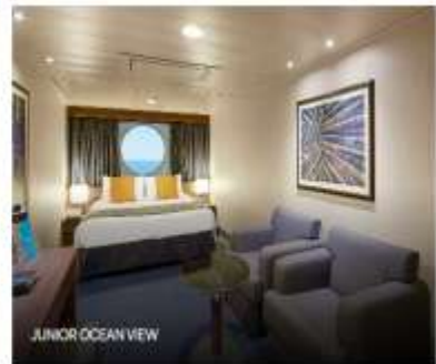
JUNIOR OCEAN VIEW