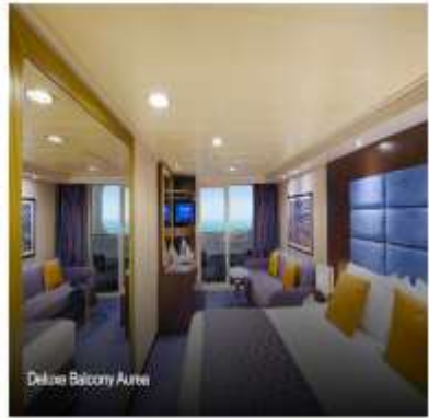
Deluxe Balcony Alrea