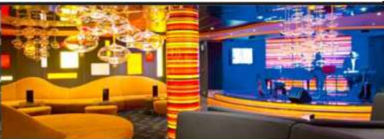
GOLDEN JAZZ BAR