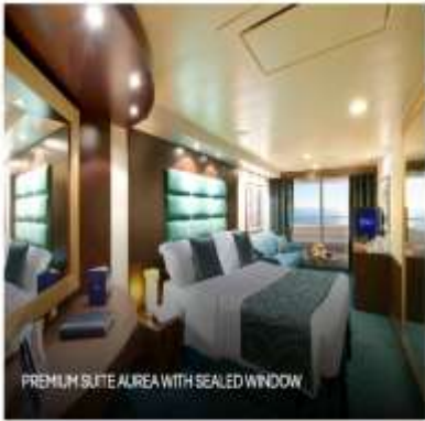
PREMIUM SUITE ALREA WITH SEALED WINDOW