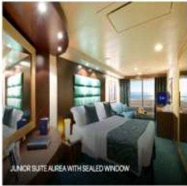
JUNIOR SUITE ALREA WITH SEALED WINDOW