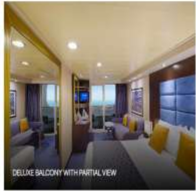
DELUXE BALCONY WITH PARTIAL VIEW