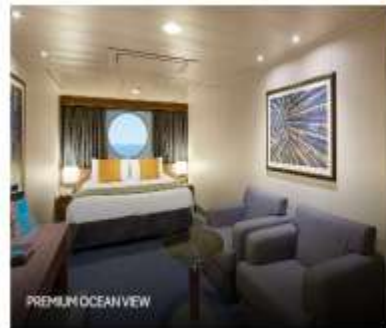
PREMIUM OCEAN VIEW