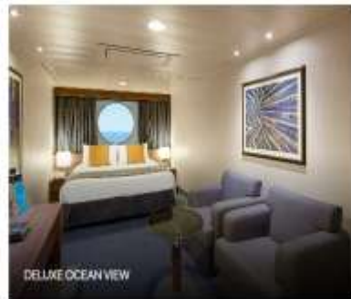
DELUXE OCEAN VIEW