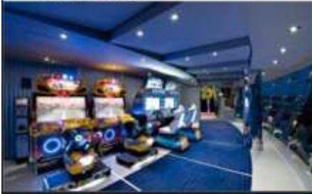
VIDEO GAMES ARCADE