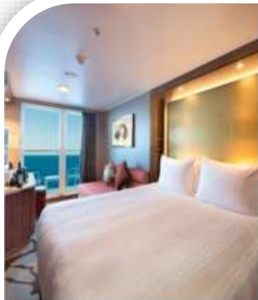
Oceanview Stateroom with Balcony