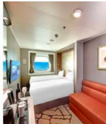
Oceanview Stateroom with Window